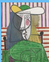
Busto de uma mulher Pablo Picasso