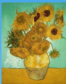
Os girassóis – Van Gogh