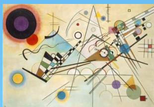
Composição VIII Wassily Kandinsky