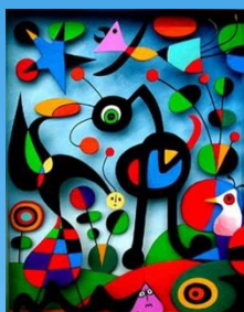
O jardim – Joan Miró