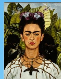
Autorretrato com Colar de Espinhos e Beija-Flor – Frida Kahlo