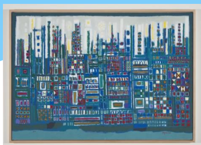
A cidade Manuel Cargaleiro