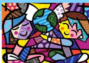
O mundo nas mãos Romero Britto